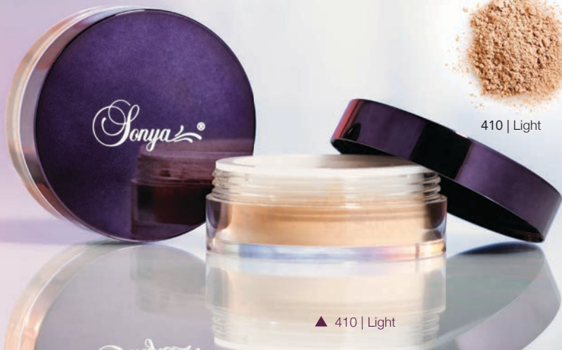
▲ 410 | Light