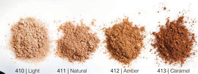
410 | Light