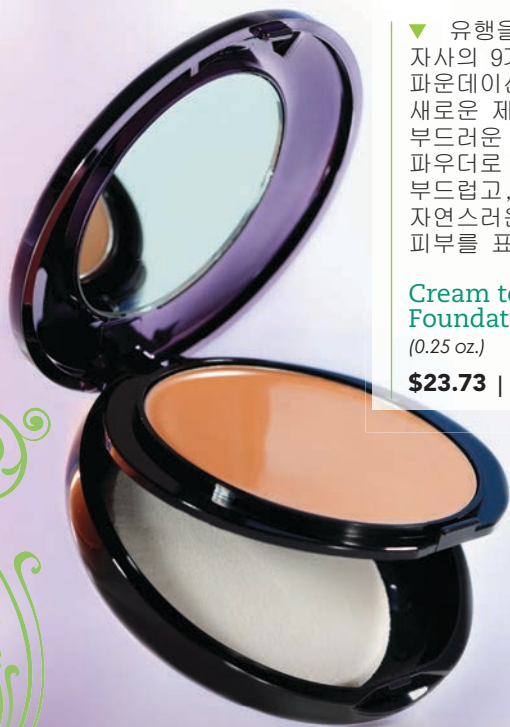
▲ 385 | Sandy

▼ 유행을 타지 않는 자사의 9가지 크림 투 파운데이션 셰이드의 새로운 제제로서 고품격의 부드러운 크림이 매끄러운 파우더로 변하여, 부드럽고, 투명하며 자연스러운 광채를 띤 피부를 표현합니다.