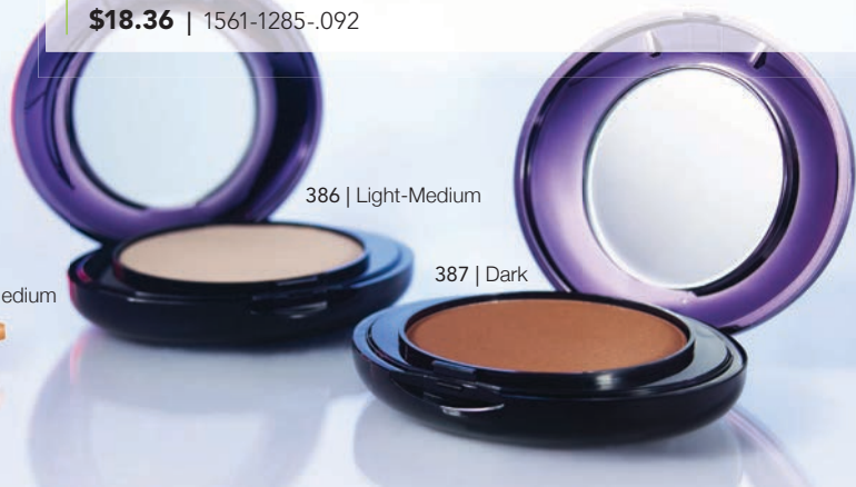
386 | Light-Medium