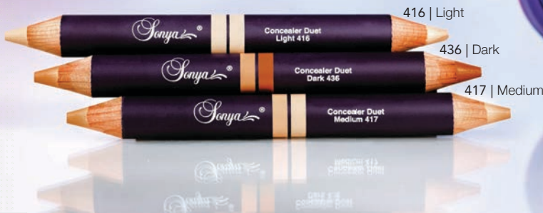
416 | Light