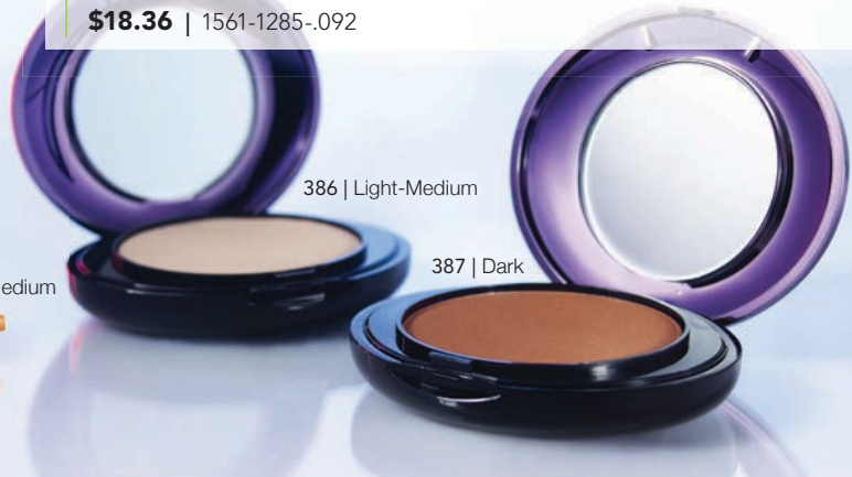
386 | Light-Medium