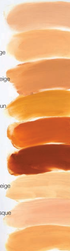
385 | Sandy