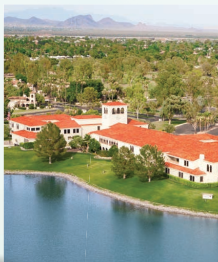
FOREVER CORPORATE PLAZA Międzynarodowa siedziba firmy Forever Living w Scottsdale, w Arizona

FOREVER LIVING PRODUCTS SPRAWDŹ DISCOVERFOREVER.COM