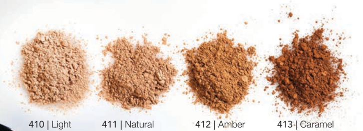
410 | Light