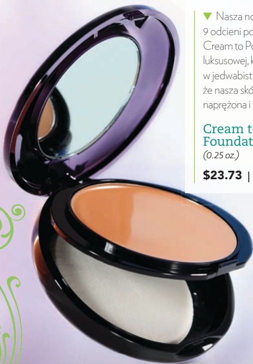
▲ 385 | Sandy

▼ Nasza nowa receptura dla 9 odcieni podkładu Timeless Cream to Powder przemienia się z luksusowej, kremowej konsystencji w jedwabisty puder, powodując, że nasza skóra staje się miękka, naprężona i naturalnie promienna.