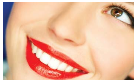
Porsche Red 130