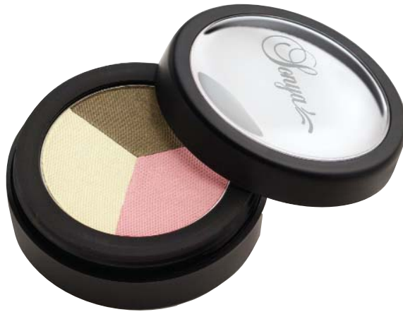
Sedona Trio 203