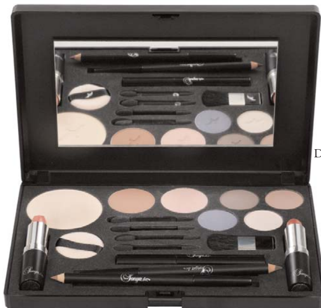
Dusty Rose 104