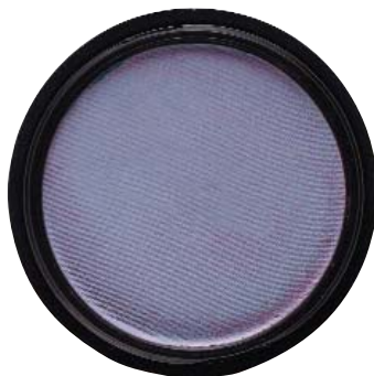
Blue Bayou 136