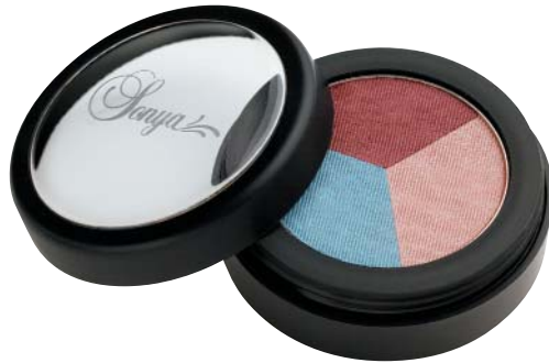
Sedona Trio 204