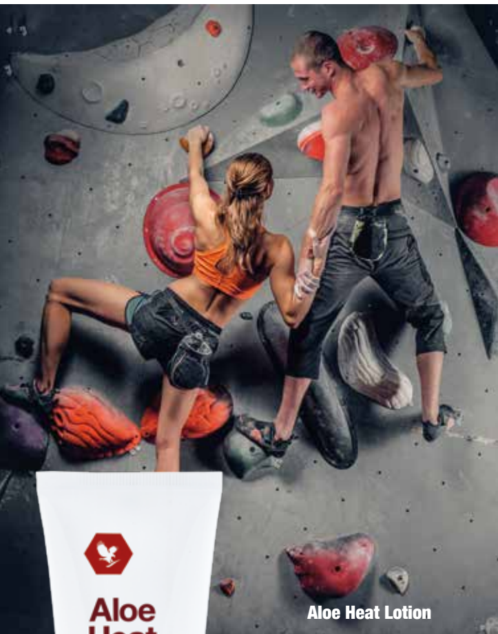
Aloe Heat Lotion