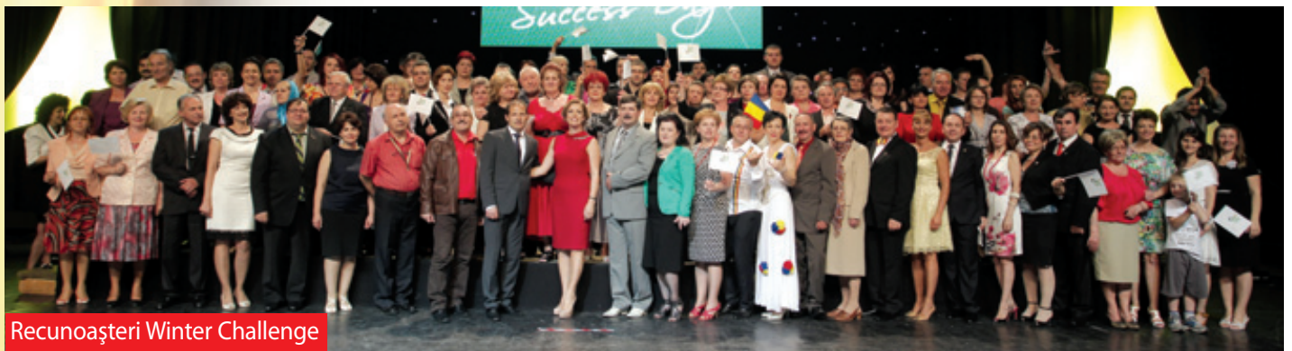
Recunoașteri Winter Challenge