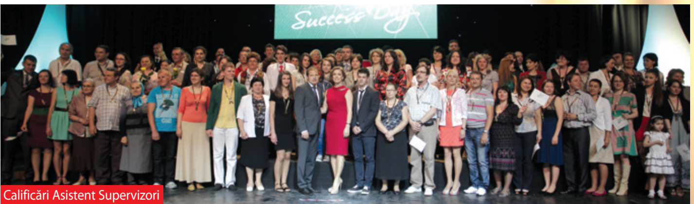
Calificări Asistent Supervizori