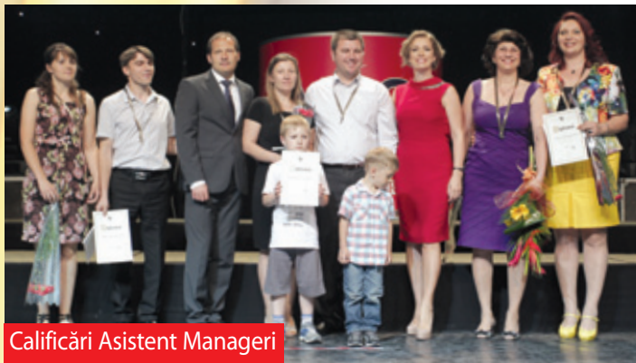
Calificări Asistent Manageri