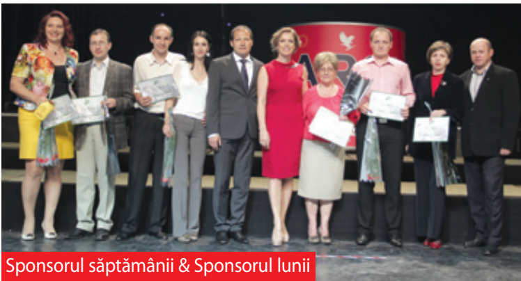
Sponsorul săptămânii & Sponsorul lunii