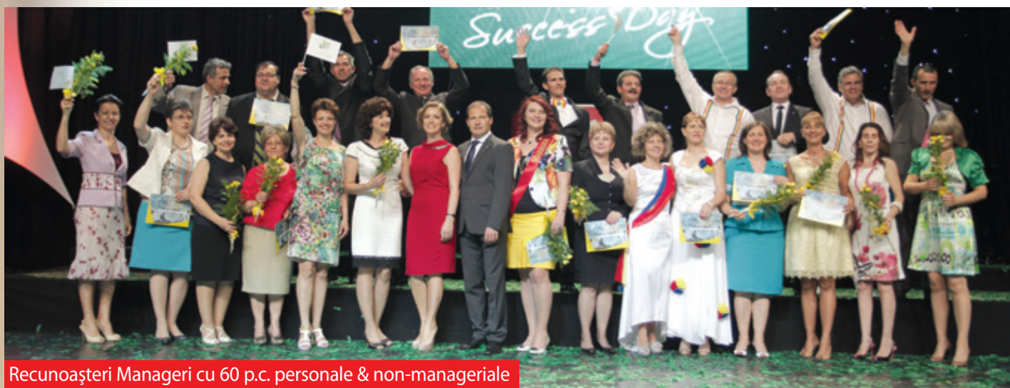
Recunoașteri Manageri cu 60 p.c. personale & non-manageriale