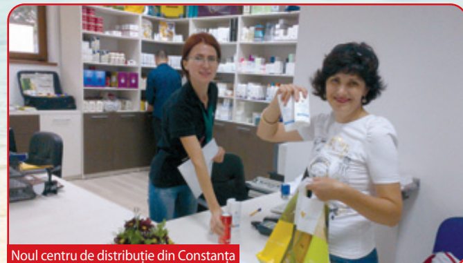
Noul centru de distribuție din Constanța