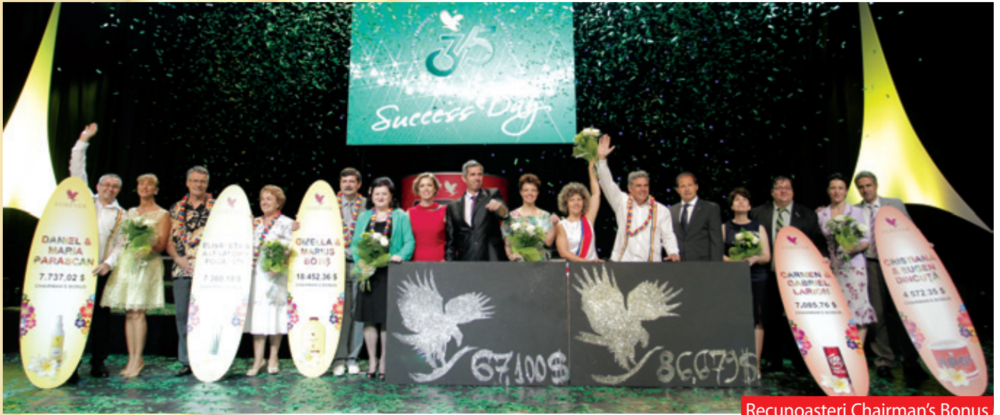
Recunoașteri Chairman's Bonus