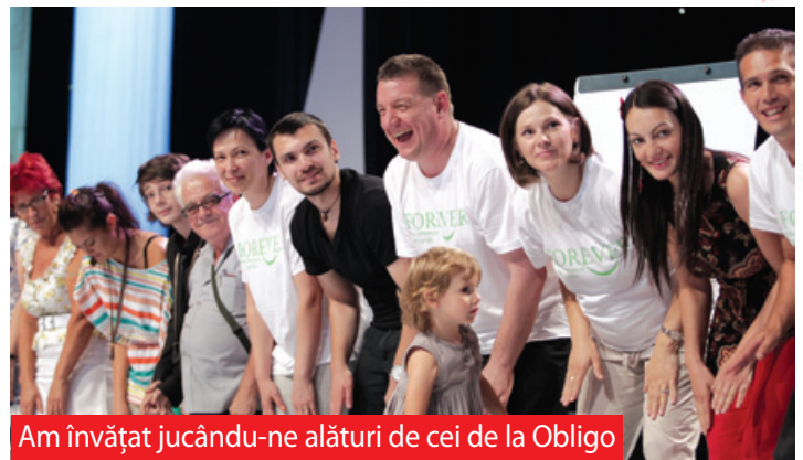
Am învățat jucându-ne alături de cei de la Obligo