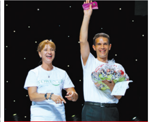
Reprezentanții echipei Moldovei au primit cu bucurie premiul pentru cea mai bună galerie