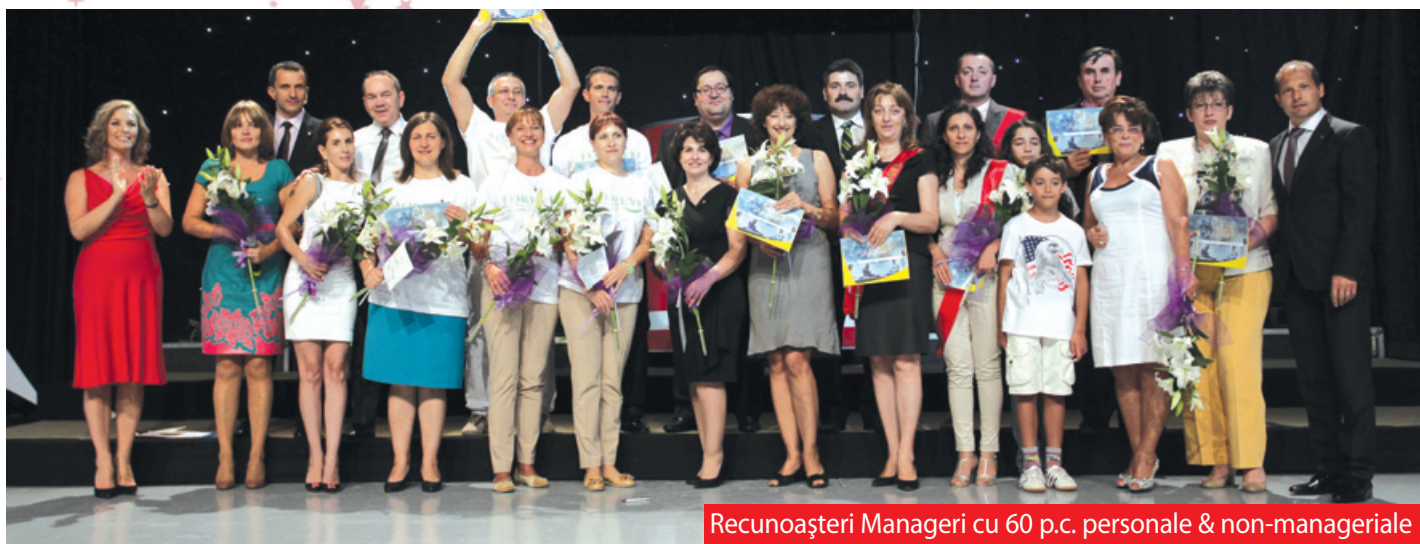
Recunoașteri Manageri cu 60 p.c. personale & non-manageriale