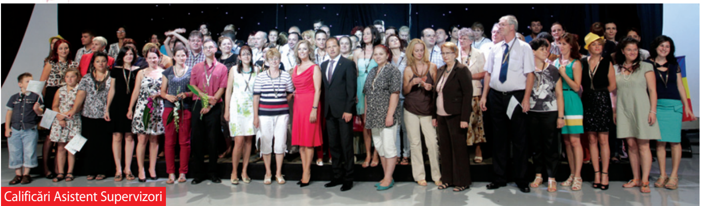
Calificări Asistent Supervizori