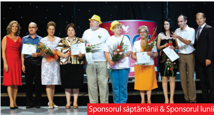
Sponsorul săptămânii & Sponsorul lunii