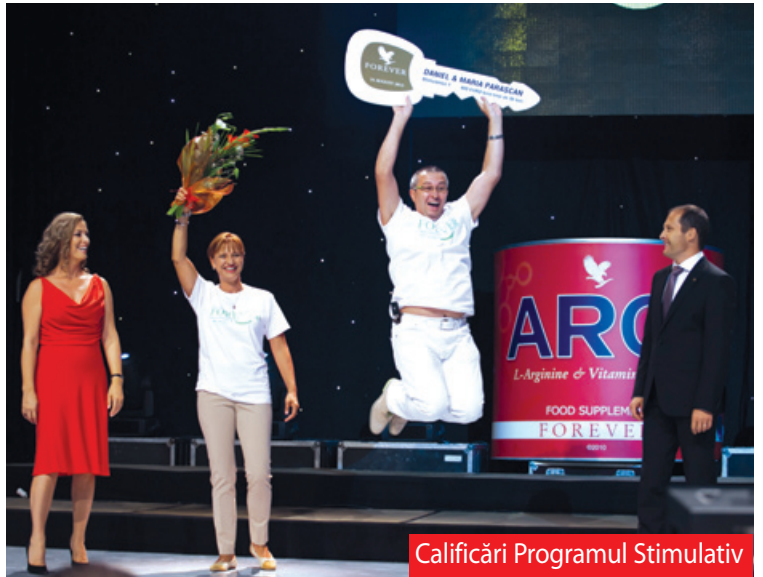
Calificări Programul Stimulativ

patra oară la Programul Stimulativ de Merit: „Am fost aici pentru că ei (echipa) au fost acolo.”