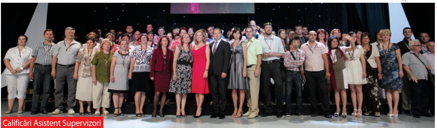
Calificări Asistent Supervizori