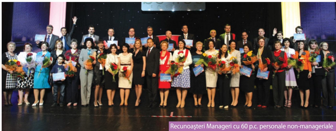
Recunoașteri Manageri cu 60 p.c. personale non-managieriale