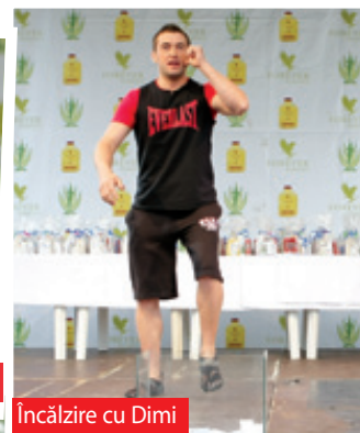
Încălzire cu Dimi