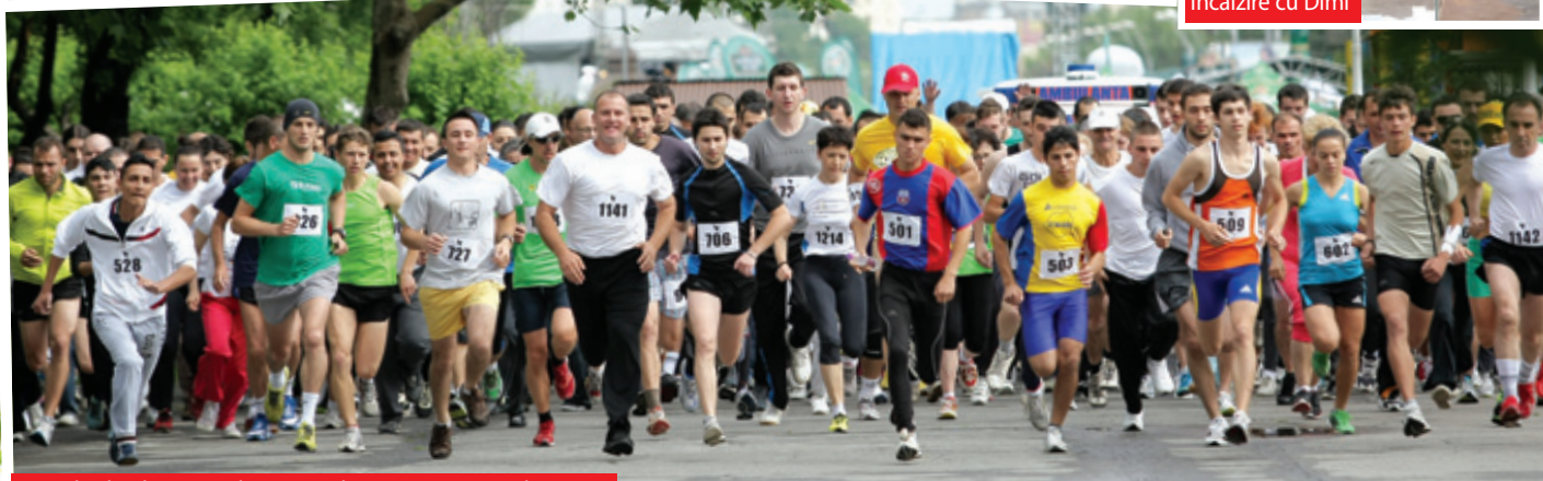
Startul celei de-a 9-a ediții a crosului „Fii sănătos cu Aloe vera”