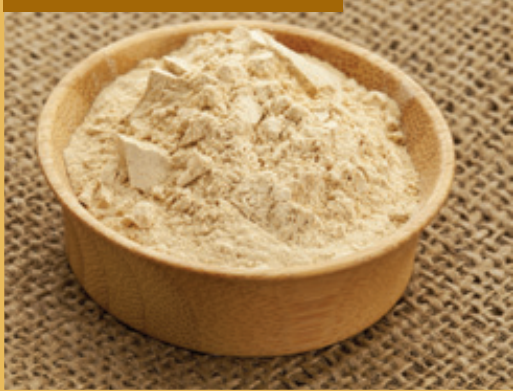
PUDRĂ DE RĂDĂCINĂ DE MACA

Un adaptogen acționează prin intermediul axei de răspuns la stres hipotalamo-hipofizo-corticosuprarenal. Cu alte cuvinte, Maca ajută la restaurarea echilibrului corpului uman și îi crește adaptabilitatea, ținând cont de necesitățile organismului în funcție de vârstă sau sex.