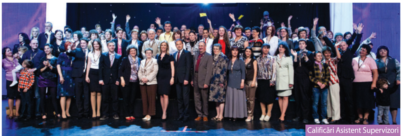
Calificări Asistent Supervizori