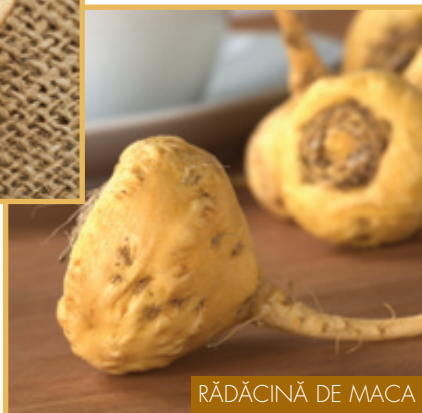
RĂDĂCINĂ DE MACA

În concluzie, rădăcina de Maca se dovedește un prețios supliment alimentar, precum și un remediu natural valoros pentru persoanele de orice vârstă, oferindu-i organismului un aport excepțional de forță, energie și rezistență.