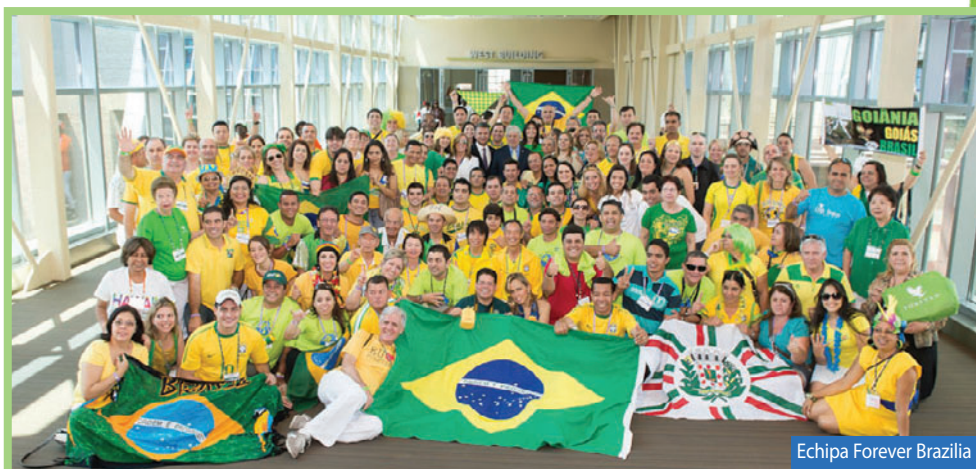
Echipa Forever Brazilia