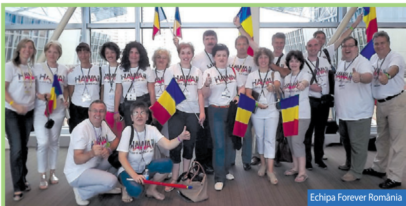
Echipa Forever România