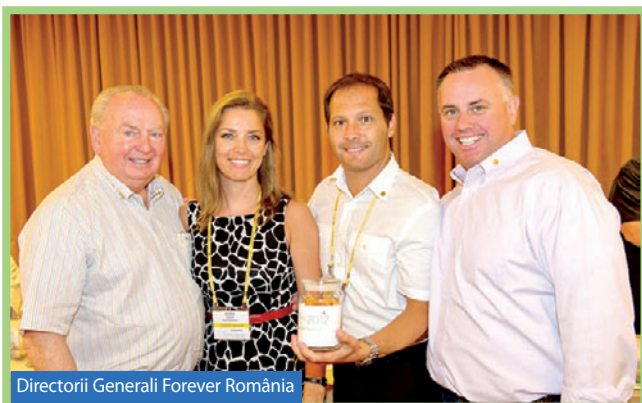
Directorii Generali Forever România