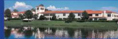
مقر فوريفر ليفينج الإداري