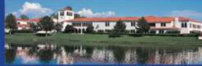
FOREVER LIVING CORPORATE PLAZA