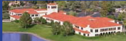
OFICINA MATRIZ DE FOREVER LIVING