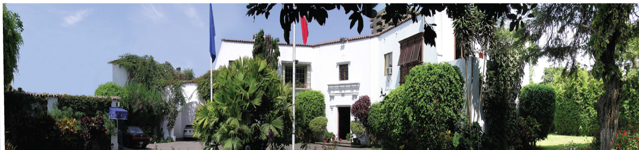
Oficina Principal Forever Living Products Perú